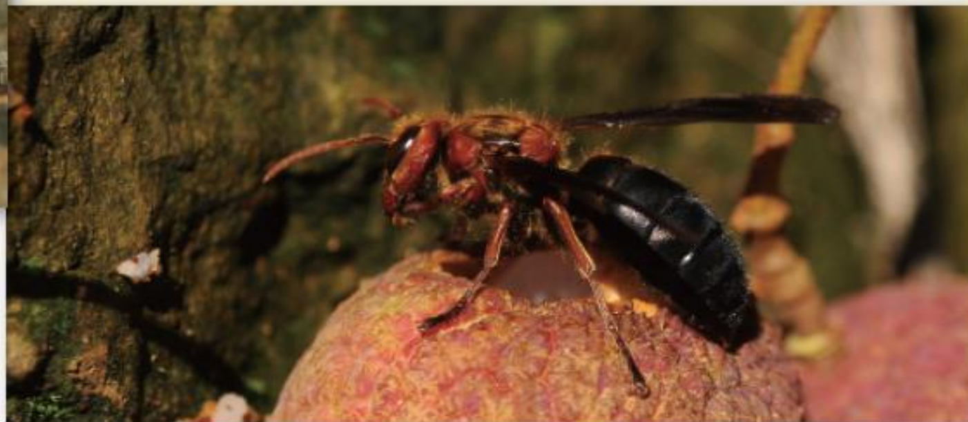
黑腹虎頭蜂