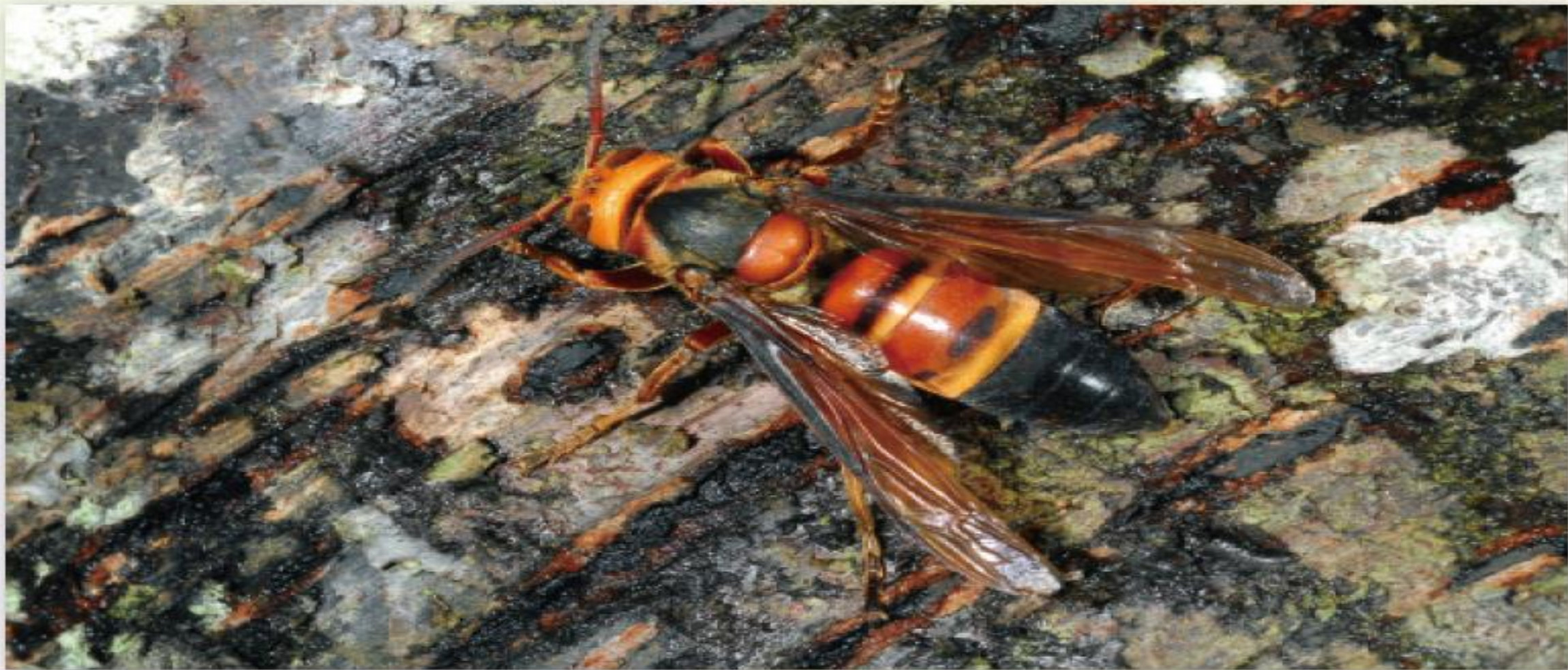
黑尾虎頭蜂