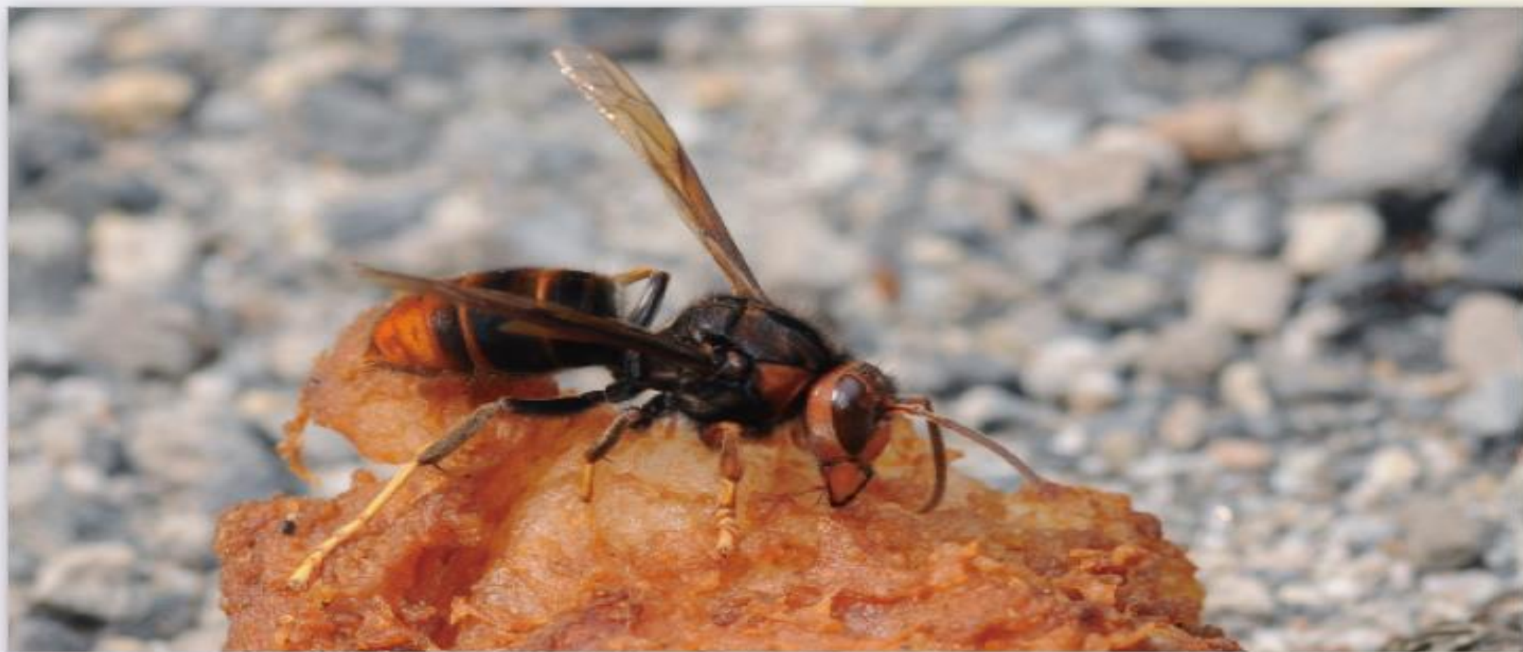
黃腳虎頭蜂